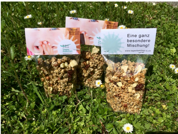
Auf dem Rapperswiler Freitagsmarkt